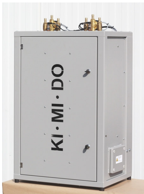
Weighing scale in cabinet SBW II 15/15