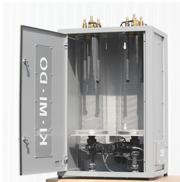
Weighing scale in cabinet SBW II 15/15 (basic model) - interior view