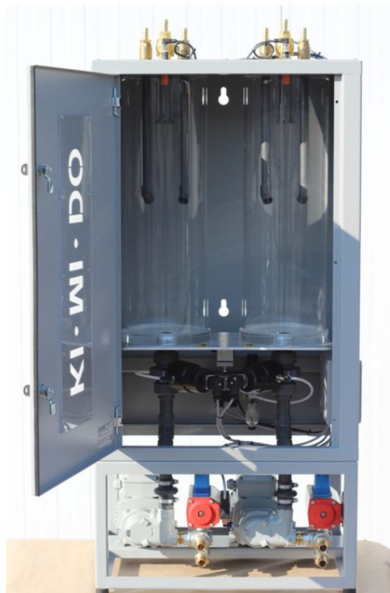
Weighing scale in cabinet SBW II 15/15 with below mounted discharging pumps and two-way distributor onto 2 mixers