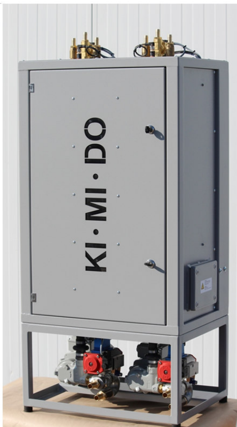
Weighing scale SBW II 15/15 with below mounted discharging pumps