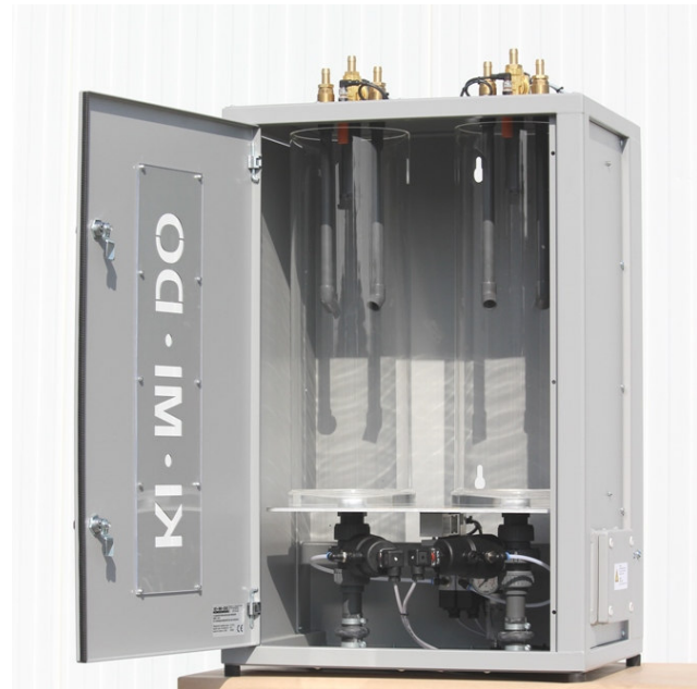
Schrankwaage SBW II 15/15 (Grundmodell) Innenansicht