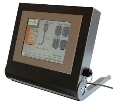
Dosiersteuerung DS 5 touch