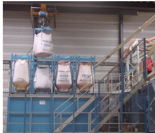
2 x PFD 4 WS für 2 Mischer

Wie dürfen wir Ihre Maschine konfigurieren?