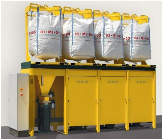
PFD 4 WS