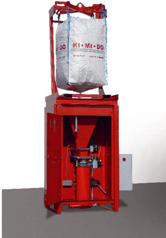
Einkomponentenmodul PFD 1 WS