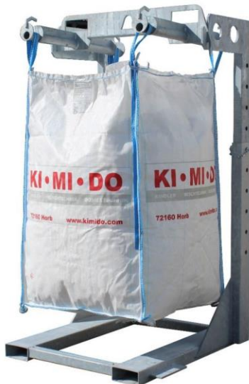
Höhenverstellbares Big-Bag-Traggestell mit Hebekreuz