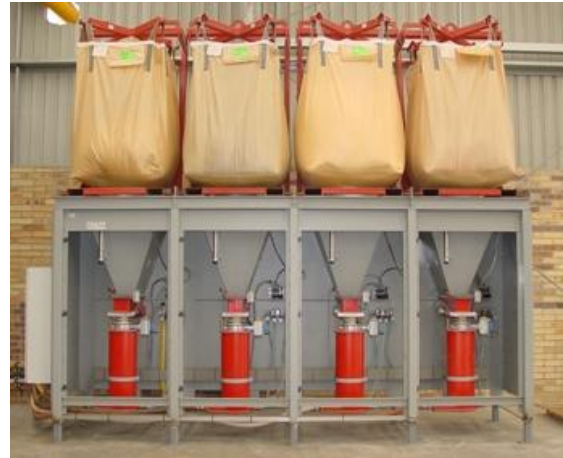
PFD 4 WS

Wie dürfen wir Ihre Maschine konfigurieren?