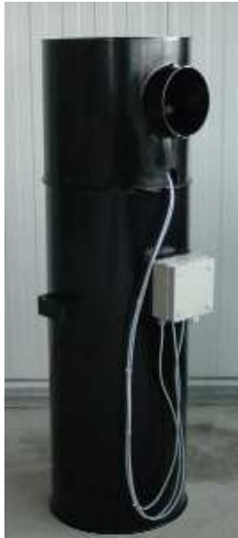
Abb.: Mischersaugentlüftung Gr. VII 7,5 m 2