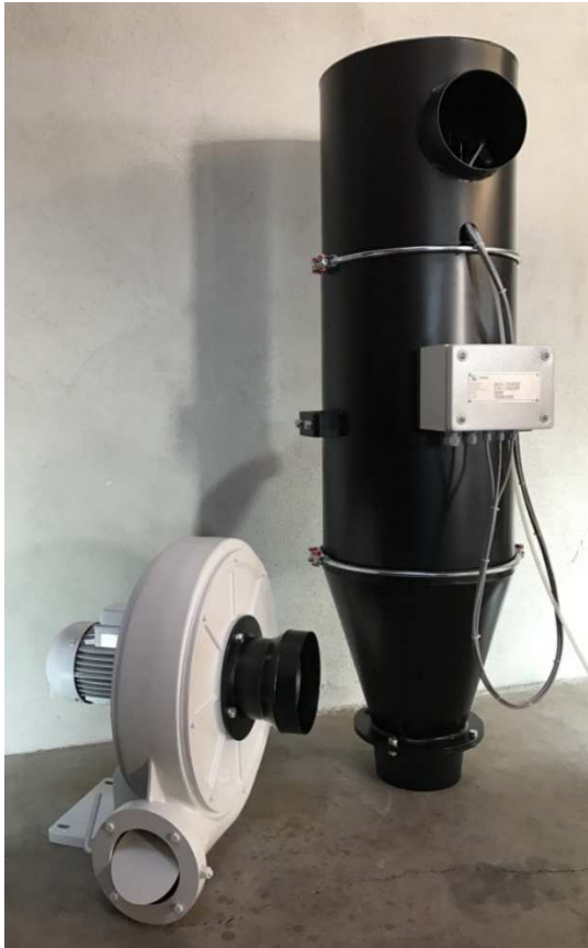
Abb.: Mischersaugentlüftung Gr. V 4,5 m 2 mit optionaler Kleinsteuerung zur Filterabreinigung