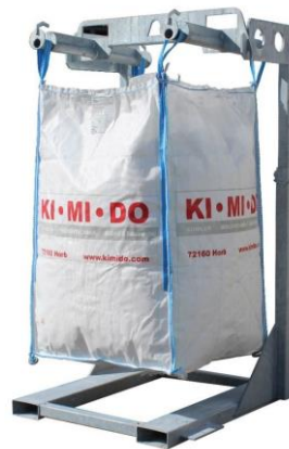
Höhenverstellbares Big-Bag-Traggestell mit Hebekreuz