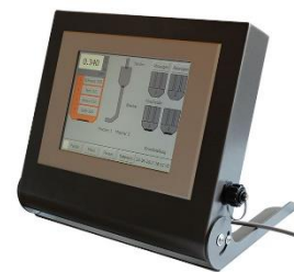
Dosiersteuerung DS 4 touch