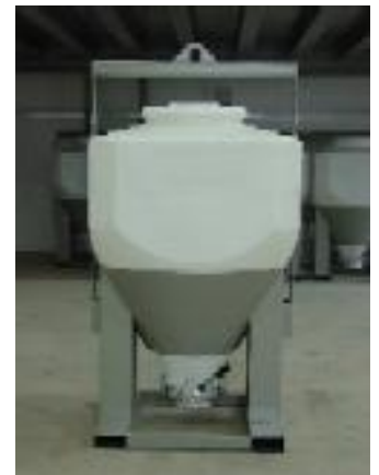
PVC-Wechselsilo 1,2 m 3