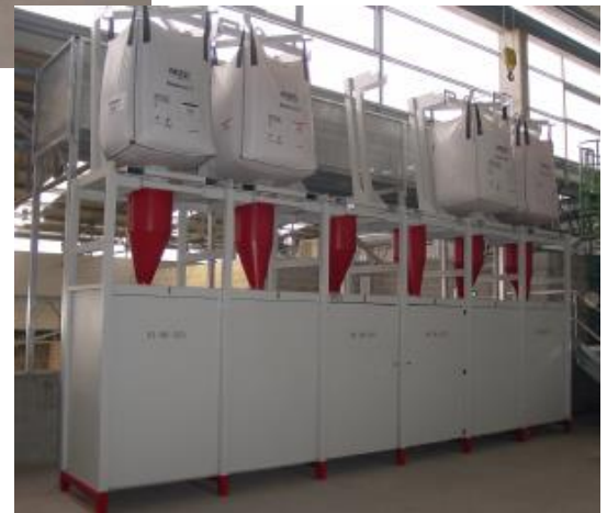
FD 6 WS mit Big-Bag-Traggestellen und Hebekreuzen