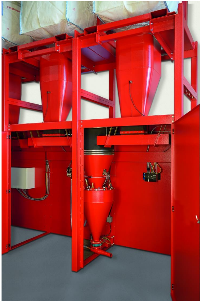
FD 3 WS Pulver - Innenansicht mit Wägesender