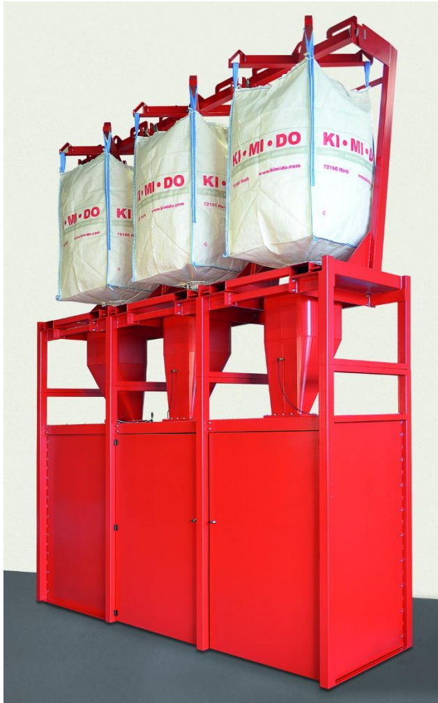
FD 3 WS P