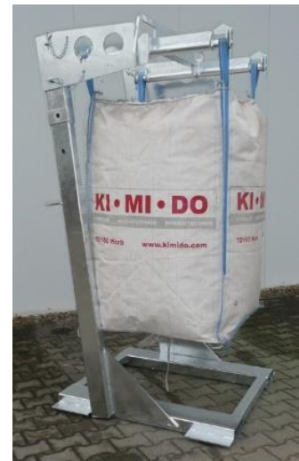
Höhenverstellbares Big-Bag-Traggestell mit Hebekreuz