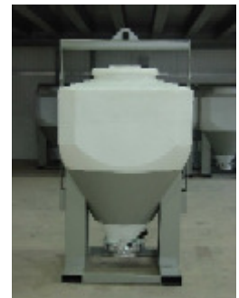
PVC-Wechselsilo 1,2 m 3