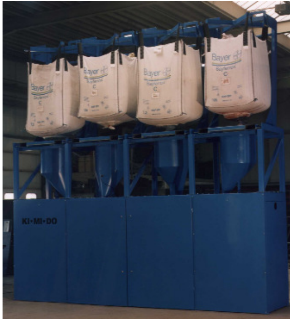
Abb.: FD 4 G