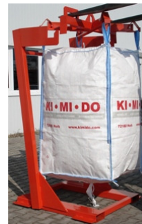
Big-Bag-Traggestell mit Hebekreuz