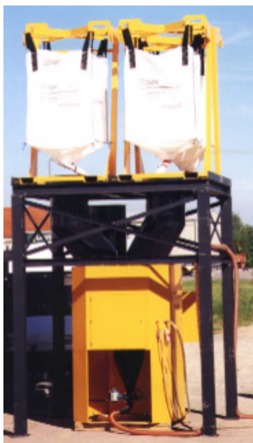
Abb.: MB 4 G