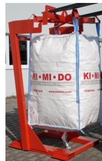
Big-Bag-Traggestell mit Hebekreuz